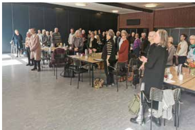
Fællessang ved højskoledagen

Højskoledag den 23. marts i Sportium i Varde med emnet ensomhed, som pårørende og som ældre generelt. Der deltog 55 frivillige. Fremover vil det blive tilbudt hver andet år i ulige år.