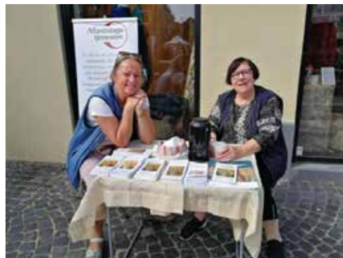
Foreningens dag 2021 - Hvor vi synligør vores tilbud og rekrutterer nye frivillige

Frivillige er blevet en integreret del på sengeafsnit E på psykiatrisk afdeling. Her er der mulighed for flere eftermiddage om ugen, at mødes med en frivillig i fællesstuen til en snak, spil eller tilbyde følgeskab på en gåtur. Siden opstart efter coronaen har vi kun været tilknyttet en afdeling, men forventer i 2022 at starte på en afd. mere.