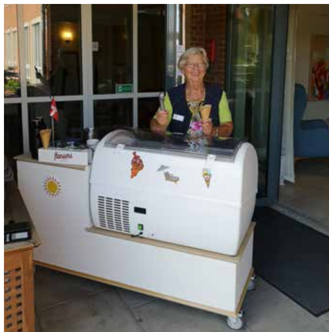
Isvognen på hospice passes af frivillige.

En stor tak for arbejdet skal her til sidst lyde til alle vore frivillige, bestyrelsen, samarbejdspartnere og støttemedlemmer, donorer og fonde der støtter os økonomisk og moralsk i vort arbejde, og er med til at vi kan føre visionerne ud livet.