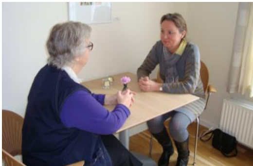
Frivillig i vågetjeneste