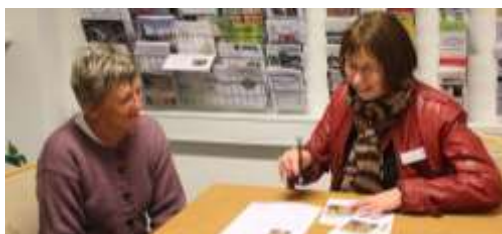
Samtale med ny frivillig